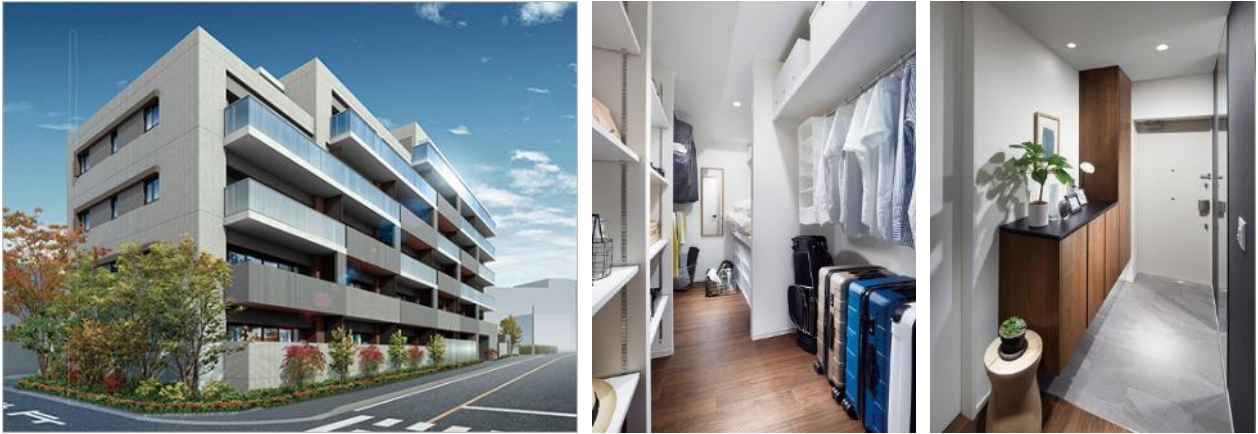
『イニシア志木レジデンス』外観完成予想図、モデルルーム・ファミリークローゼット、ウエルカムホール（玄関）