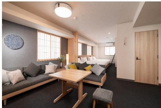
客室 (定員 6 名)