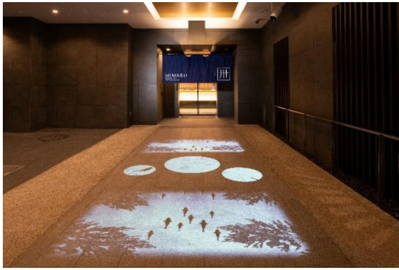
エントランス (プロジェクションマッピング)