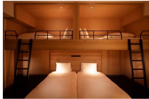
客室 (定員 4 名 ロフトベッド)