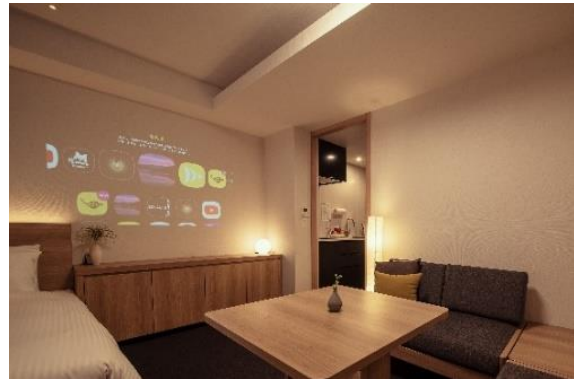
客室 (popIn Aladdin)