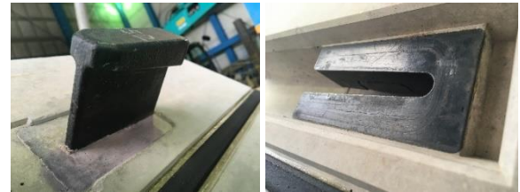
写真1 T型金物(左)、C型金物(右)