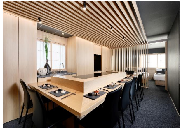
寿司カウンター付きプレミアムルーム

「APARTMENT HOTEL MIMARU（アパートメントホテル ミマル）」（ https://mimaruhotels.com/ ）は、全客室キッチン付き、ダイニングスペースも備わった広い室内でご家族がゆっくりお過ごしいただける空間・サービスを提供し、日本での新たな滞在スタイルを提案しています。