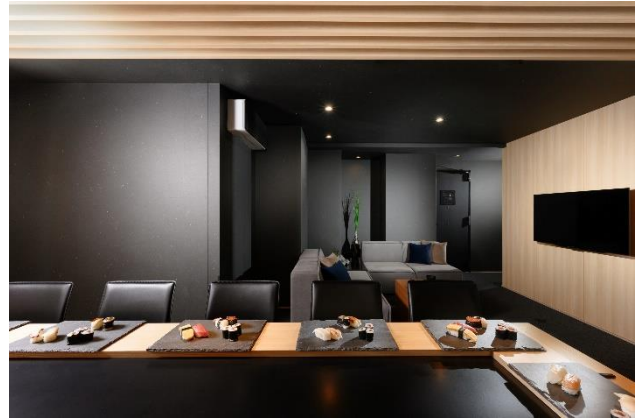
寿司カウンター付きプレミアムルーム