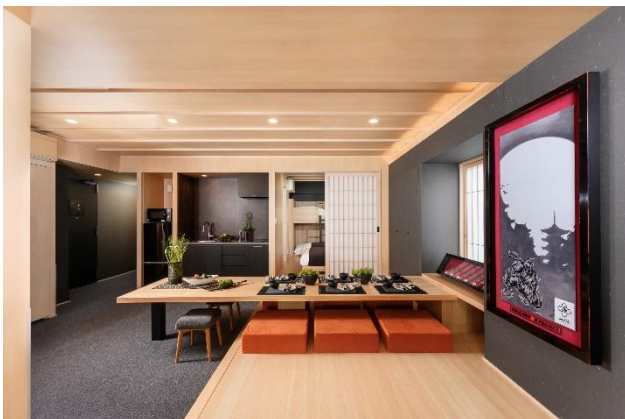
忍者ルーム（キッチンダイニング）