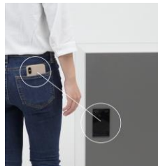
近づくともBluetoothが繋がる

スマートキーについてのニュースリリース： https://www.nasta.co.jp/news/2020/202012101.html