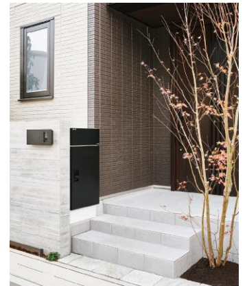
「Next-Dbox」シリーズ設置イメージ