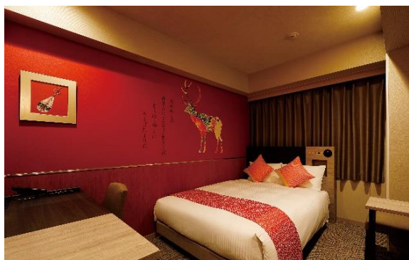
《スタンダードダブル》