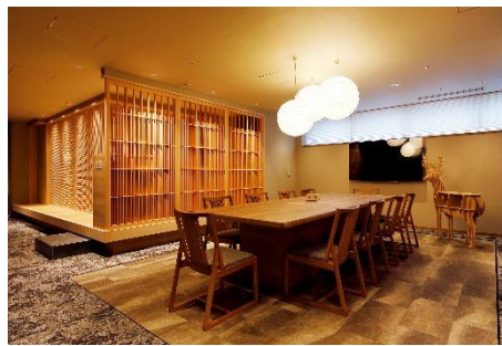
《2F ソーシャルコーナー「TSUKUE」》