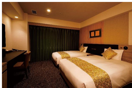
《スーペリアツイン》