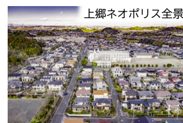
上郷ネオポリス全景

また、昨年試乗体験を実施した「グリーンスローモビリティ（電動カート：ヤマハ発動機（株）製）」も11月1日（日）～12月23日（水）の期間、新たにデマンド型運行を追加して地域内を巡回します。