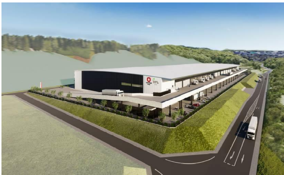
「DPL仙台利府」外観パース

大和ハウス工業株式会社（本社：大阪市、社長：芳井敬一）は、2021年3月30日より、宮城県宮城郡利府町において、マルチテナント型物流施設 ※1 「DPL仙台利府」（敷地面積：41,300.28㎡、延床面積：48,565.43㎡）を着工します。