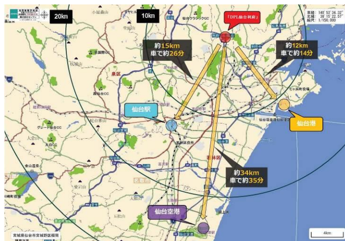
「DPL 仙台利府」周辺地図①