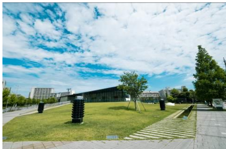
【「葛飾にいじゅくみらい公園」】