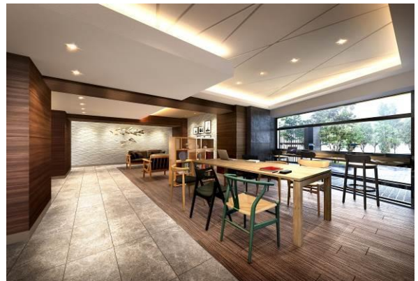
【「サブエントランスホール」イメージ】