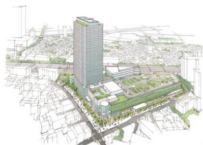
【「(仮称)東金町一丁目西地区第一種市街地再開発事業」 (完成予想パース)】