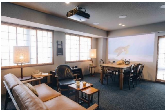
プレミアム2ベッドルームジャパニーズスイート

※3. 2021年7月開業時の販売想定価格平均です。料金は客室・時期により変動します。詳細はHPをご確認ください。