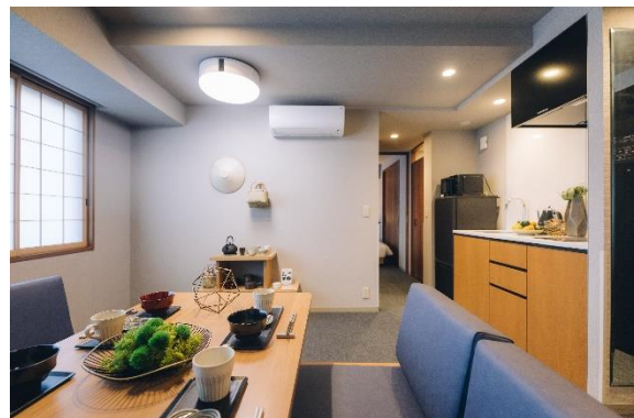
2ベッドルームスイート