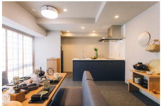
『MIMARU SUITES 京都四条』 客室 (リビング・ダイニング)

「アパートメントホテル ミマル (MIMARU)」は、約40㎡からの広い客室にキッチンやリビング・ダイニングスペースを備え、ご家族・グループでの中長期滞在ニーズに対応する都市型アパートメントホテルです。このたび、新しく誕生する「MIMARU SUITES」は、全室2ベッドルーム以上のスイートタイプで構成された「MIMARU」の新シリーズです。コロナ禍で一層多様化するライフスタイルに合わせ、その街で暮らすような自由な滞在を楽しんで欲しい、という思いから、より広い客室に、リビング・ダイニングとベッドルームを分け、プライベート空間を確保しました。旅先の街や客室で家族や仲間と楽しみながら、それぞれの時間も大切にする、“暮らすような滞在”を一層追求した都市滞在型旅行をお届けします。