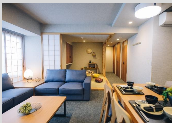
「MIMARU SUITES」シリーズ 客室例 リビング・ダイニングキッチンと 2つ以上の独立した寝室