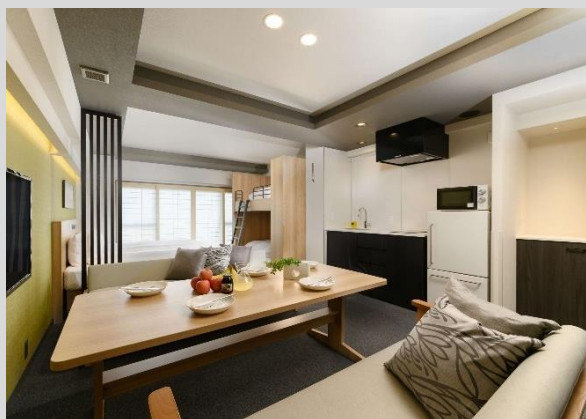
「MIMARU」シリーズ 客室例 約40㎡からの広い空間 ワンルームタイプ中心