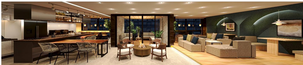
↑キッチン・ダイニング

共用フロアはキッチン・ダイニング・ラウンジ・ライブラリー・暖炉・オープンテラスがあり、過ごし方に合わせた空間をつくることで、入居者同士での料理作りや飲み会、友人との雑談、ひとりでの読書など気分に合わせて居場所を選ぶことができます。また、建物全体で快適に働くことができる環境（働きやすい家具、ドリンク、Wi-Fi）を備え、オンライン会議や集中作業、アイデア創出など、働き方によって空間を使い分けられ、自分らしい自由な働き方を実現できます。