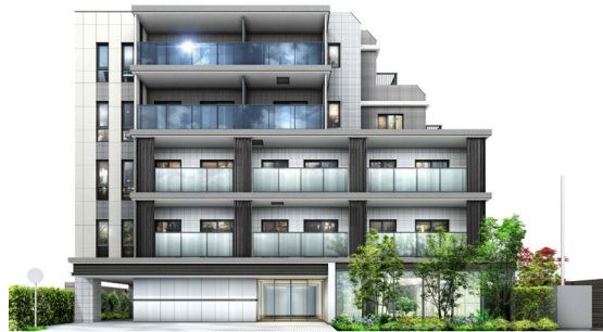
【「プレミスト調布クロス」外観パース】

大和ハウス工業株式会社（本社：大阪市、社長：芳井 敬一）は、東京都調布市において分譲マンション「プレミスト調布クロス」（地上5階建て、総戸数65戸）を建設中ですが、2021年9月16日より販売を開始します。