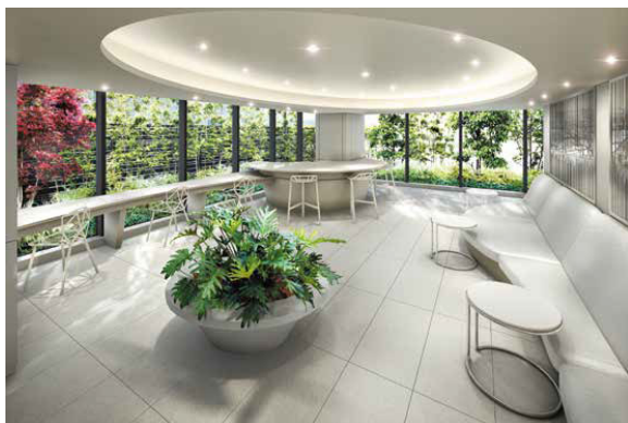
【コネクトラウンジ】イメージ

また、ご入居者のライフスタイルに合わせ、1K・1DK・1LDK・2DK・2LDKの全27タイプの間取りを用意しました。あわせて、専有部の廊下の面積をコンパクトにすることで、リビングやキッチン、収納などの空間を可能な限り広く設けられるプランとしました。