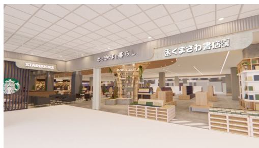
【本と珈琲と暮らし】

スターバックスやくまざわ書店などが併設する「本と珈琲と暮らし」では、本やコーヒー、生活雑貨、レッスンスクールなどが一つのゾーンに集まることで、日常使いに広がりを生み、お客さまの興味に新たな発見を提供します。