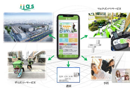
【クラウドサービスを介した新たなサービス】