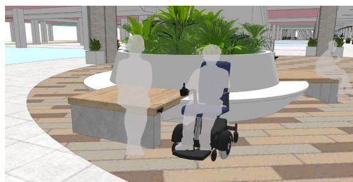
【電動車いす専用の充電コンセント】

施設全体が、車いすやベビーカーでの移動も快適になるよう、凹凸の少ない床材を採用。施設内のサインは見やすさ・わかりやすさを重視し、多数のピクトグラムを掲示しました。設備面でも、車いすをご使用のお客さまに配慮した施設として、フードホールには高さ調整が可能なテーブルや片アームいすなどを含む様々ないすを設置するとともに、「NATURE FIELD」には電動車いす専用の充電コンセントを導入しました。