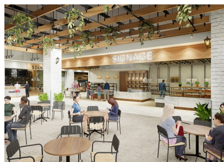
【KASUGAI MARCHE (かすがいマルシェ)】