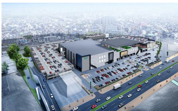
【「イーアス春日井」外観イメージ】

大和ハウス工業株式会社（本社：大阪市、社長：芳井敬一）は、愛知県春日井市において開発中の大型商業施設「iias（イーアス）春日井」（以下「イーアス春日井」）を、2021年10月22日に開業します。