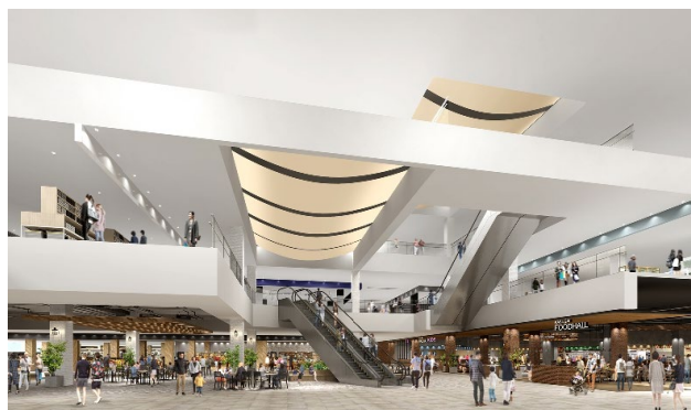
【「イーアス春日井」内観イメージ】

「イーアス春日井」は、商業施設「ザ・モール春日井店 Part 1」跡地に開発される、3階建て・延床面積約8.2万㎡の春日井市最大の大型商業施設です。