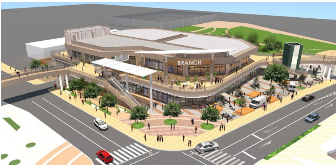
「ブランチ茅ヶ崎3」完成予想パース※イメージであり実際とは異なる場合があります。

※「インクルーシブ遊具」とは体に障害がある子も、ない子も一緒になって遊ぶことができる遊具です。