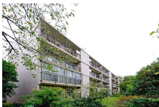
【建替え前「丸山町南住宅」】

大和ハウス工業（本社：大阪市、社長：芳井敬一）は、「マンションの建替え等の円滑化に関する法律（以下：「円滑化法）」※1を活用した分譲マンション「プレミスト文京千石」（地下1階地上4階建て、総戸数58戸、うち分譲戸数39戸）※2を2021年12月2日に竣工し、2022年1月15日より引渡しを開始しますのでお知らせします。