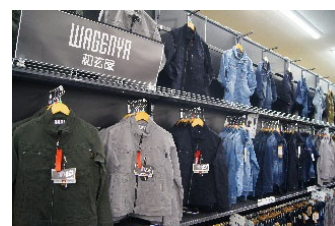
「当社オリジナルブランド和玄屋の作業服」