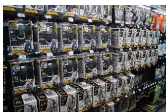
「ハーネスなどの安全用品」