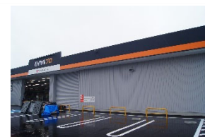
「サッと出られる積込場」

また、早朝営業（6 時 30 分～）に加え、大型商品購入後の車への積み込みサポートなどを実施し、朝早い建築現場での作業開始前に、より便利にご利用いただけます。