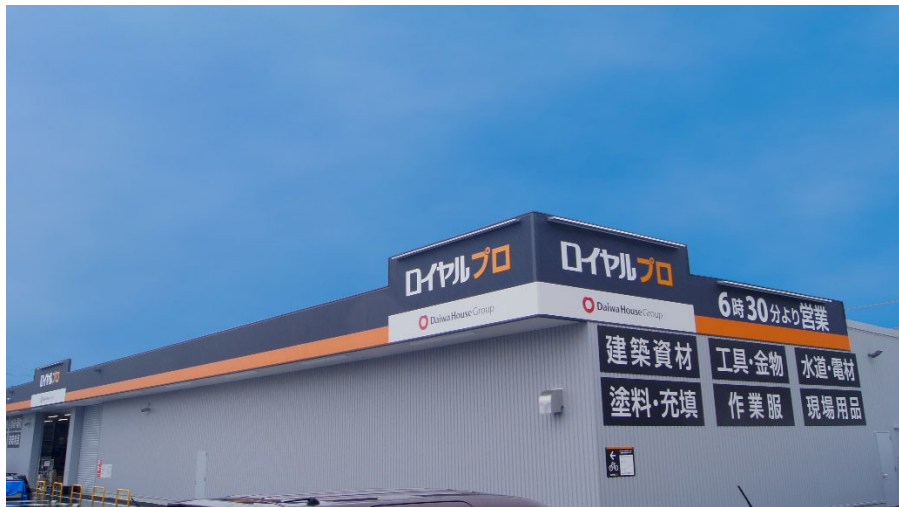
【 ロイヤルプロ横浜港北インター 】

なお、当店のオープンにより、当社が運営するホームセンターは全国で58店舗目、神奈川県下で11店舗目となります。