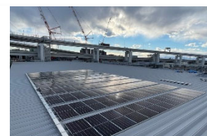
「太陽光発電システム」

当店では「人と地球にやさしい」共創共栄を目指した店舗づくりとして、店舗の屋根面に太陽光発電システム（発電容量 49.90kW、年間発電量 60,263kWh）を導入し、店舗を運営する上で発生する消費電力の一部を自店で賄い、年間約 2.6t の CO 2 排出量削減効果を見込んでいます。