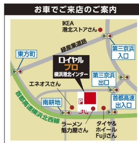
「ロイヤルプロ横浜港北インター」(案内図)