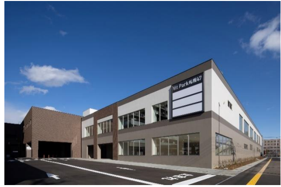
スポーツクラブNAS 2階スタジオ/外観