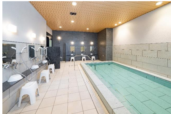
『イニシアグラン札幌イースト』 カフェダイニング／大浴場