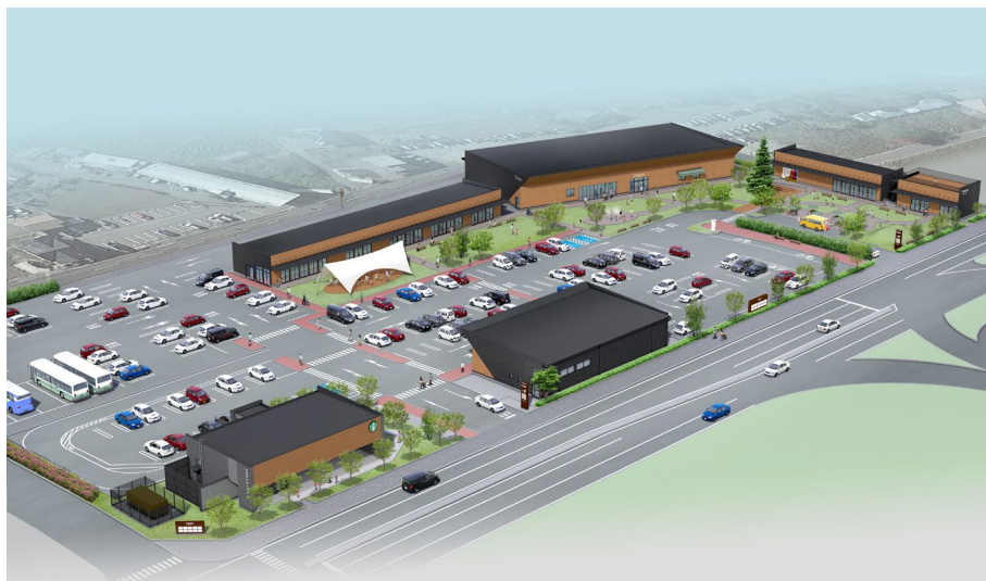
完成予想パース ※イメージであり実際とは異なる場合があります。

※「フレスポ佐久インター」の麺屋燕村は2018年10月、スターバックスコーヒーは2019年4月、SANCHは2021年5月にオープンしています。