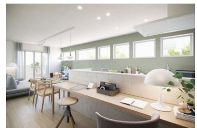
開放的なオープンキッチン

在宅時間の増加に伴い、自宅で食事をする「内食」時間も増加しています。「TORISIA」では、家族と常につながりを感じることができる開放的なオープンキッチンや、シンク周辺の4口コンセントの設置など、毎日の食事時間を便利で豊かにするキッチン空間を提案します。