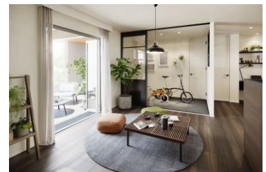
土間とつながるリビング

また、リビングと一体化した土間スペースやバルコニーなど、内と外がつながる開放感のある空間を提案します。