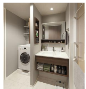
収納も充実した洗面空間

また、eコマースの利用で増えた梱包ゴミなどを一時的に保管できる場所を、キッチン周辺や玄関、廊下などにも提案します。