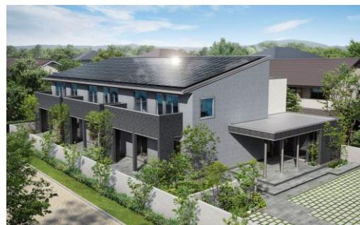
太陽光発電システム搭載イメージ