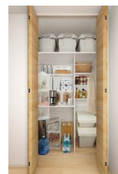
棚が可変できるマルチストレージ