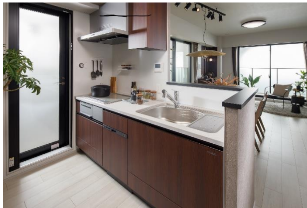
『ザ・福井タワー イニシアグラン』モデルルーム