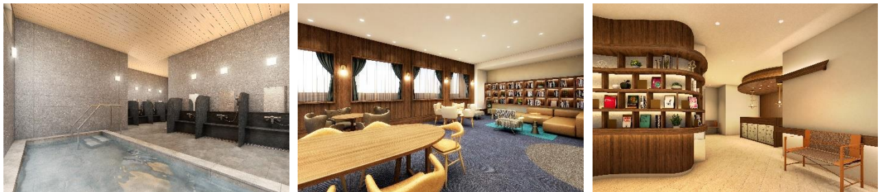
『ザ・福井タワー イニシアグラン』 大浴場 / クラブラウンジ / コンシェルジュデスク (3点とも完成予想図)

入居者さま同士が自然に交流できるよう、ゆるやかなつながりを醸成し、このマンションならではの協奏・交流を実現していくための共用空間を設けます。男女別の大浴場・キッチン付きのクラブラウンジ・楽器の練習もできるスタジオなどをご用意しています。