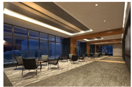
再開発建物全体 / 再開発内施設「フードホール」 / 「ザ・福井タワー」エントランスラウンジ (3点とも完成予想図)