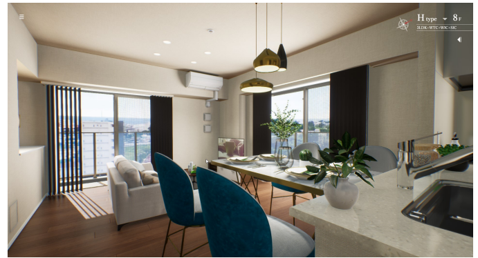
VRモデルルーム（CGにて制作）

当社では、2020年2月より、分譲マンションをご検討いただくお客さまの利便性の向上や竣工物件の販売促進のため、一部の分譲マンションにおいて、VRモデルルームを導入。CGで制作したモデルルームや360度カメラで撮影した実際のモデルルームを、場所や時間の制約なくWeb上で内見できるため、ご好評いただいています。