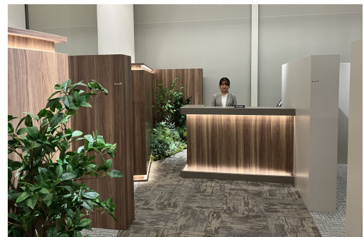
「プレミストサロン東京」内観

※6. 物件 URL : https://www.daiwahouse.co.jp/mansion/kinki/kyoto/gojo/