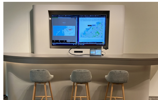
物件閲覧コーナー