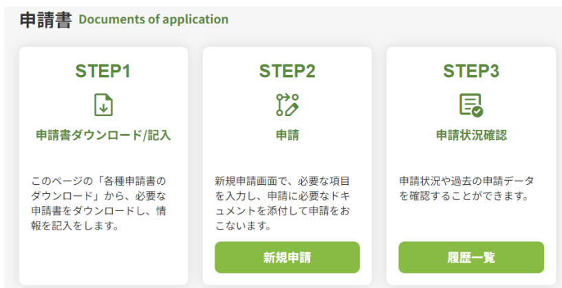
【「申請書」画面イメージ】

入居テナント企業からの変更工事申請、駐車場利用契約、セキュリティーカード作成申込等