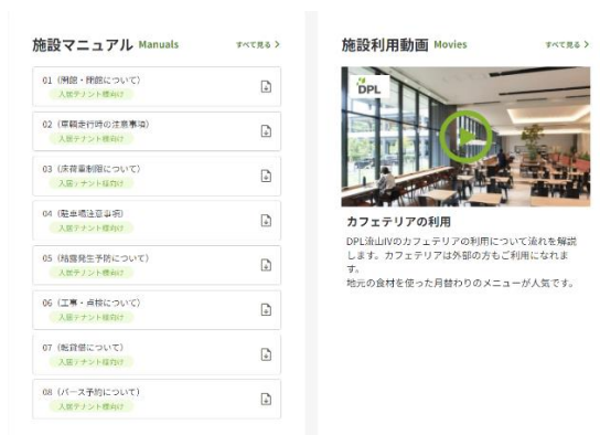
【「施設マニュアル・動画」画面イメージ】

入居テナント向けご案内（工事関係・結露対策・トラックバース管理予約システム等）、施設で働く従業員向けご案内（カフェテリア利用方法・ドライバー休憩所利用方法・保育施設利用方法・交通アクセス等）