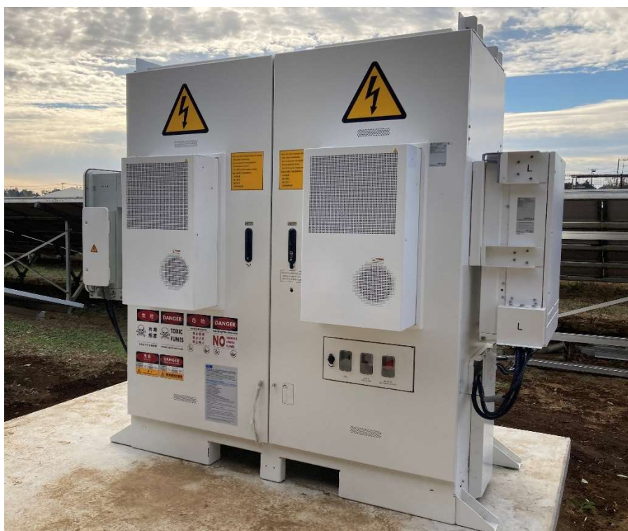
写真 新設した蓄電池