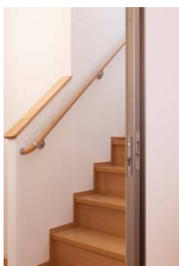
階段手前の仕切り扉