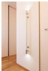
イルミサポートバー

※1. ユニバーサルデザインの考え方を核として、「住まいと家族みんなが、いつまでも仲良くあるための空間づくり」を目指した、当社独自のデザインコンセプトです