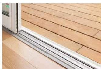
フラットスルーウィンドウ