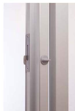
チャイルドロック付扉