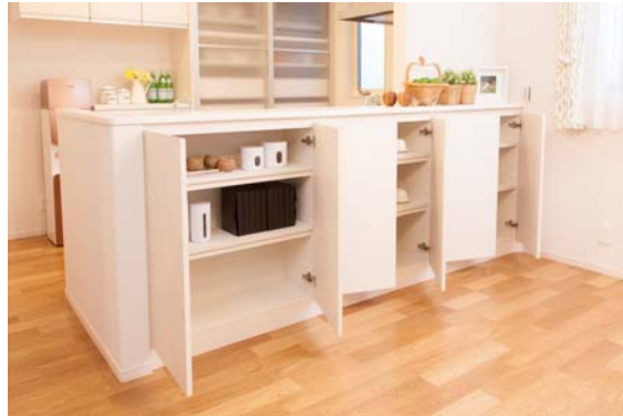
スマートビューカウンター