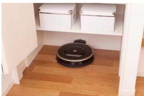
ロボット掃除機の基地

加えて、屋外多目的防水パンを設け、冷水だけでなく温水も出るようにしました。ドロ遊びのあとの子どもの汚れを温かいお湯で洗い流すことができます。