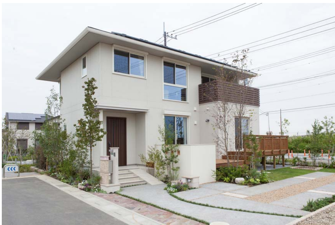
「+Child first（プラスチャイルドファースト）の家」