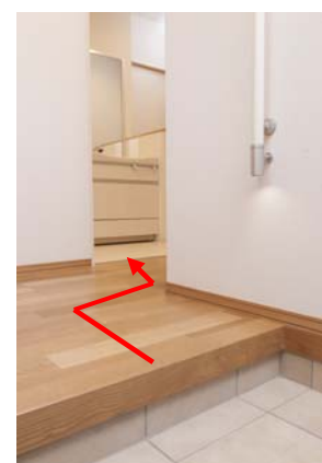
とりあえず洗面導線