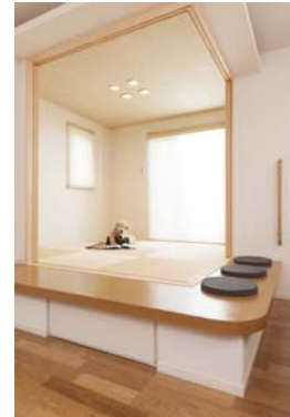
ステップアップタタミルーム