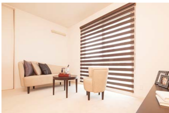
セカンドリビング

その一方で、親子で利用できるスマートデスクと伝言板・お絵かきコーナーとして利用できるマグピタボード設けました。親子で並んで作業ができるのでコミュニケーションの場として使えます。マグピタボードにはメモや子どもの作品を磁石で留めることができるので、壁を傷つけません。また、家族に見守られながら宿題をする場所としても最適です。