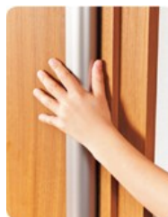
フィンガーセーフドア