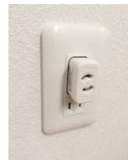
マグネットコンセント