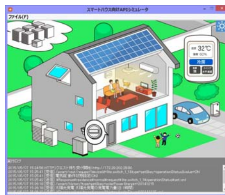
【スマートハウス向けシミュレーター】