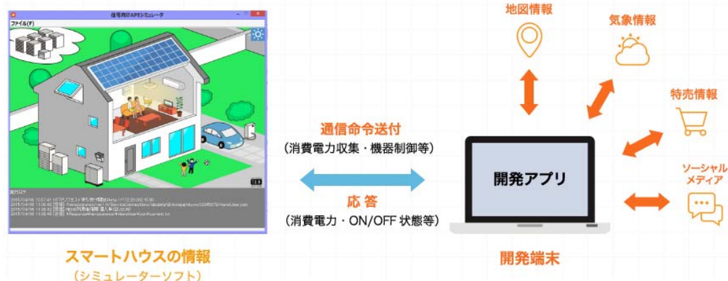
【開発するアプリのイメージ】