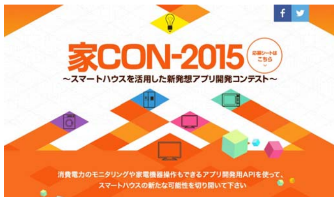
【家 CON-2015 トップページ】

「家 CON-2015」 特設サイト http://www.ux-xu.com/daiwa-api/