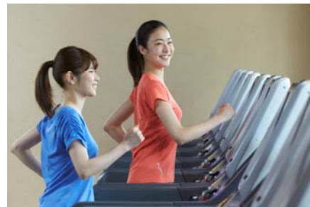
【スポーツクラブ NAS イメージ】

その他、ご応募いただいた全ての方の中から、抽選で5名さまに「特別賞」としてスポーツクラブ NAS の商品をプレゼントします。