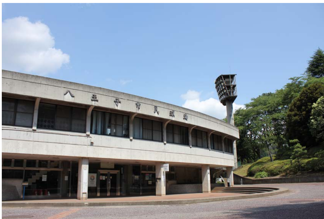
【富士森公園野球場(八王子市民球場)】