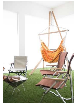
共用アウトドア備品例 (ハンモックは対象外)