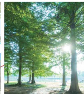
倉人公園【約2710m/徒歩34分】