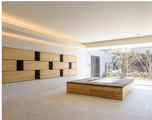
mu. su. bi. ホール