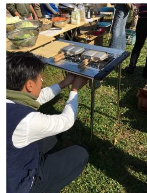
アウトドアイベント (2017年11月開催)