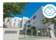
鳥根小学校【約270m/徒歩4分】