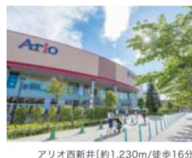
アリオ西新井【約1.230m/徒歩16分】