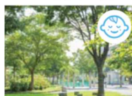
鳥根中郷公園【約140m/徒歩2分】