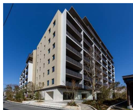
『イニシア西新井』外観