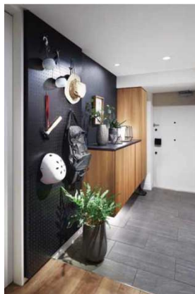
ご自宅での備えもアウトドアグッズの活用を提案

1階のmu. su. bi. ホール（エントランスホール）は、多彩な交流を生み出す共用空間です。コミュニティ醸成の場となることに加え、ラウンジの壁面に設けた棚やベンチ下収納には、ご入居者のみなさまにご使用いただけるアウトドア用品を備えます。キャンプやバーベキューなどの際に貸し出すほか、万一の防災備品としての役割も担います。