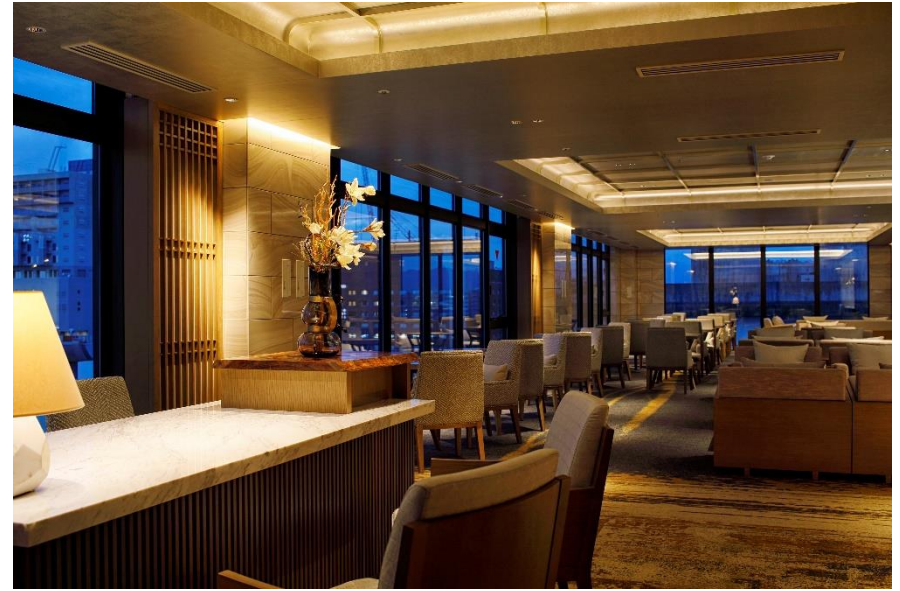
9階<エグゼクティブラウンジ>