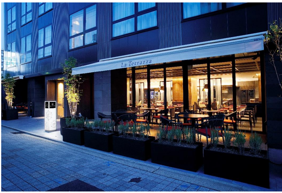
<オールディダイニング「ラ・テラッツァ」>