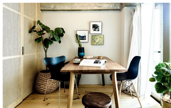
リグナが提案するアート空間イメージ