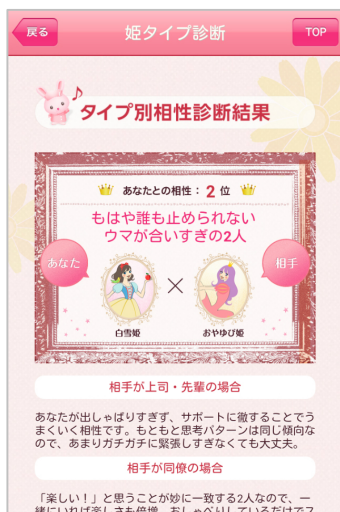
(タイプ別相性診断結果)