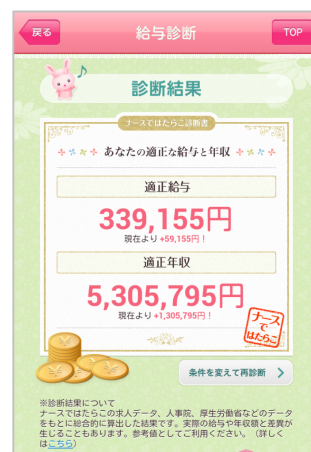
(適正給与診断結果)

※診断結果は、「ナースではたらこ」の求人情報の他、人事院、厚生労働省の信頼できる統計データを元に作成しています。