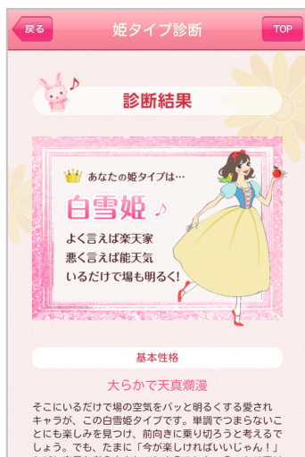
(姫タイプ診断結果)

休憩中や食事の時などに先輩・同僚・後輩の看護師さんと一緒に楽しんでいただけます。