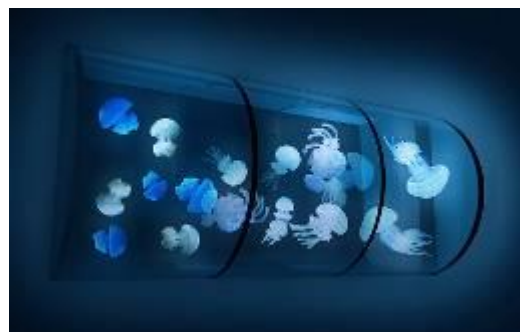
壁面に設置する 3 つのドラム型水槽（イメージ）

今回のリニューアルにより、館内で展示する約 14 種 700 匹のクラゲはすべて、すみだ水族館で繁殖をした個体となります。