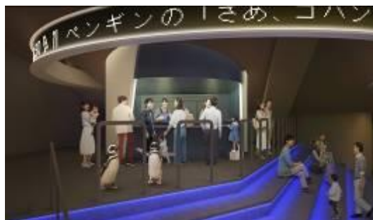
飼育スタッフとのコミュニケーション（イメージ）

飼育スタッフとのコミュニケーションや飼育作業の観察を通して、子どもだけでなく大人の知的好奇心も刺激する学びのエリアとなります。新しい「ラボ」では、今回初めて展示するビゼンクラゲやキャノンボールジェリー、ブラックシーネットルなど多くの種類のクラゲの繁殖活動に取り組み、クラゲに関する体験プログラムなども今後開催する予定です。