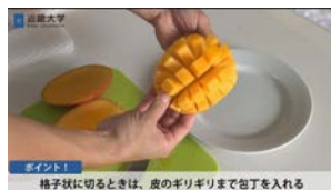
近大公開講座 激ウマ、マンゴーの育て方