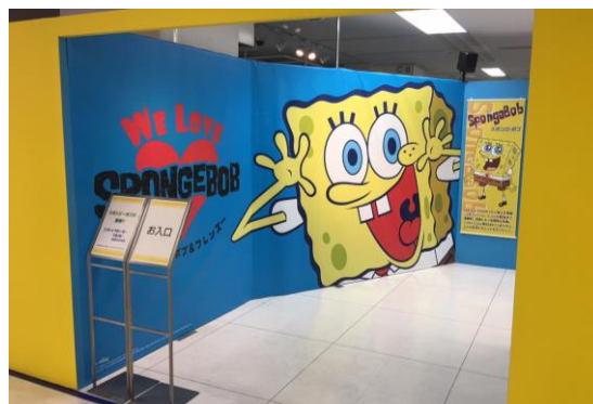
【スポンジ・ボブとゆかいな仲間達がお出迎えます！】