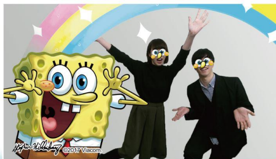
【スポンジ・ボブに食べられちゃうように見える写真や、自分の顔がスポンジ・ボブに変化した写真が撮れるコーナーも！】