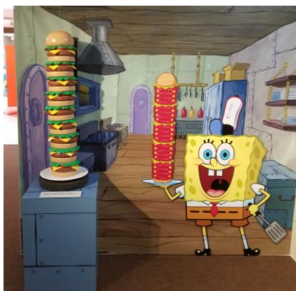
【職場のカニカーニにも行けちゃう！】