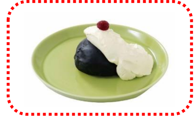
爆弾シュー 680 円