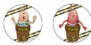
缶バッジ 350 円