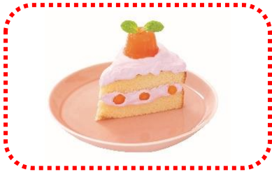
人参ケーキ 780 円