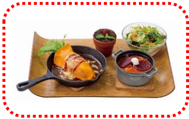
人参ステーキ 1580 円

ここでしか食べられない期間限定オリジナルコラボメニュー全6種類！！ぜひこの機会にお楽しみ下さい。