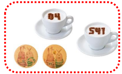
囚人ラテ 680 円 (クッキー付き)