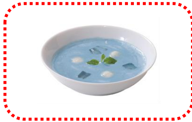
メカネコの青いデザートスープ 780 円