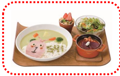
プーチンの野菜シチュー 1580 円