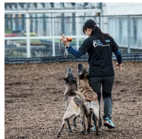
災害救助犬のデモンストレーションイメージ