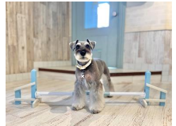
ミニアジリティ イメージ