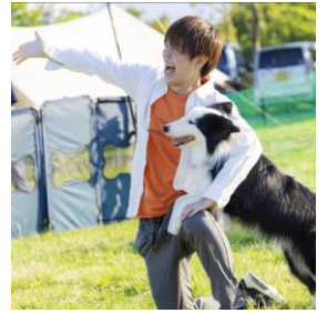
ドッグダンス イメージ