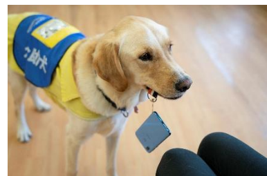
介助犬のデモンストレーション イメージ