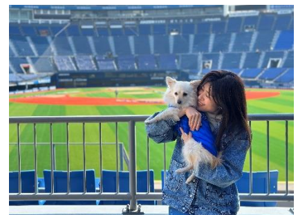
「DREAM GATE STAND」での撮影イメージ