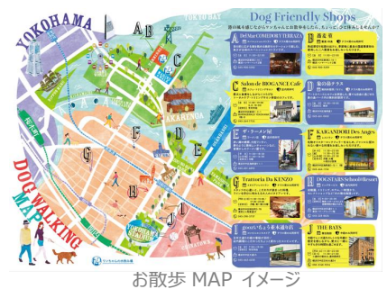
お散歩 MAP イメージ

ハマスタまでの道のりを愛犬と一緒に楽しくお散歩できる、お散歩 MAP が登場！MAP では、愛犬とのお散歩途中に楽しめる店舗や施設など、定番から穴場のスポットまでご紹介します。新たな発見をしながら、愛犬とのお散歩をもっと楽しく、充実した時間をお過ごしいただけます。