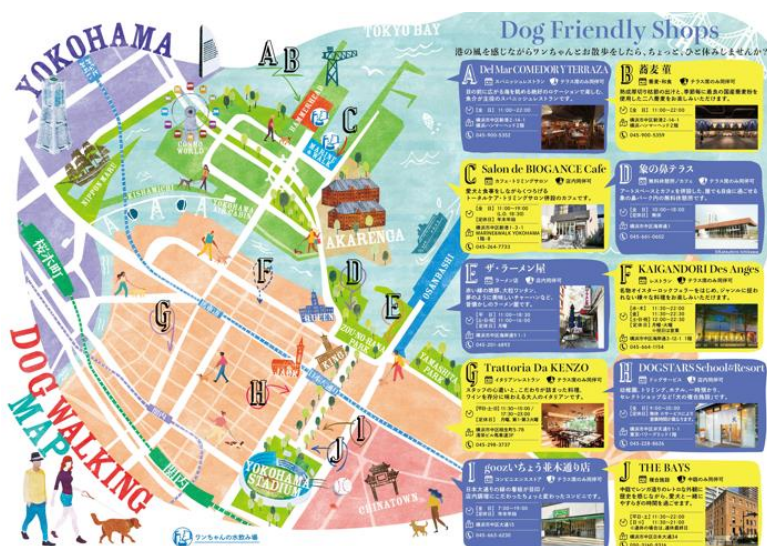
(上段) お散歩 MAP (下段) コンテンツ一例