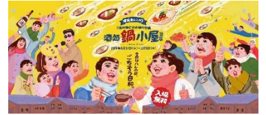
イベントキービジュアル