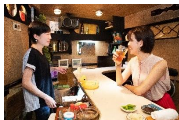
「スナック横丁」イメージ