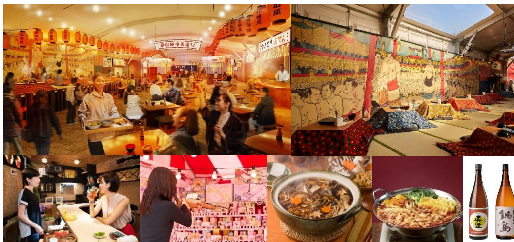
上段左から：会場イメージ、作る鍋エリアイメージ 下段左から：スナックブースイメージ、縁日ブースイメージ、鍋・日本酒イメージ

横浜赤レンガ倉庫では、2026 年 1 月 17 日（土）～2 月 1 日（日）の計 16 日間、横浜赤レンガ倉庫イベント広場にて『酒処 鍋小屋 2026 supported by ダイショー』を開催します。