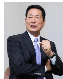
横浜 DeNA ベイスターズ元監督 中畑 清氏