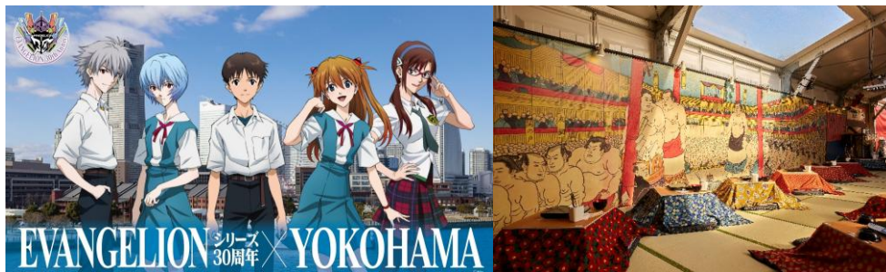
左から：「EVANGELION シリーズ 30 周年×YOKOHAMA」キービジュアル、作る鍋エリア イメージ

さらに、今年は TV アニメ放送開始から 30 周年を迎えた『エヴァンゲリオン』シリーズと横浜エリアがコラボしたイベント「EVANGELION シリーズ 30 周年×YOKOHAMA」と連動し、スペシャルコラボ鍋が初登場。ファンにはたまらない、ここでしか味わえない特別な鍋を堪能いただけます。