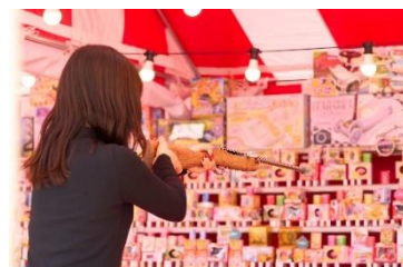
「縁日ブース」イメージ

毎年人気の「縁日ブース」が、今年はさらにパワーアップ！お祭りで楽しむような“屋台ゲーム”、昔懐かしいアーケードゲームなどが楽しめるほか、キッチンカーでは「りんご飴」「大判焼き」「抹茶クレープ」などの和スイーツもご用意！大人も子どもも一緒に楽しめる、にぎやかな縁日空間をお届けします。