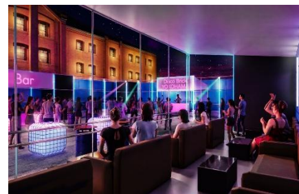
有料 BOX シート イメージ

「ディスコは気になるけど、人混みや立ちっぱなしの状態は避けてゆっくり楽しみたい」という方向けに、有料の BOX シートもご用意します。くつろぎながら、横浜の夜景や音楽、ドリンクを楽しめるワンランク上の特別空間。開放的なロケーションの中、仲間との会話を楽しんだり、音楽に耳を傾けたりと、それぞれのスタイルでイベントを満喫いただけます。ディスコの華やかな雰囲気を感じながら、少し贅沢なナイトタイムをお過ごしください。