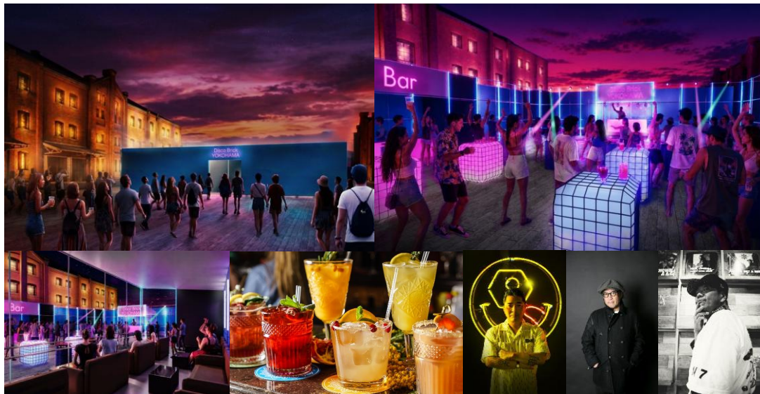
(上段)『Disco Brick YOKOHAMA』会場イメージ

横浜赤レンガ倉庫では、2026年8月8日(土)から8月23日(日)の計16日間、横浜赤レンガ倉庫イベント広場にて、1970年代から1980年代にかけて世界的にブームとなった「ディスコ」をイメージした音楽イベント『Disco Brick YOKOHAMA』を初開催します。