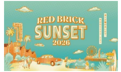
『Red Brick Sunset 2026』キービジュアル