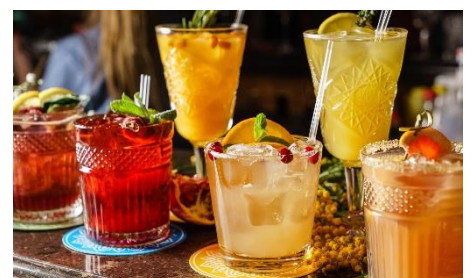
カクテル イメージ