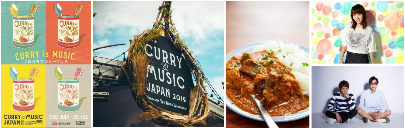
<メインビジュアル・昨年度イベントの様子・イベント限定『オリジナルレトルトカレー』イメージ・出演アーティスト>

カレーを愛するアーティストとコラボしたイベント限定のレトルトカレーをつくるため、 ここでしか観られない特別ライブ視聴券などを特典とした、クラウドファンディングをスタート!