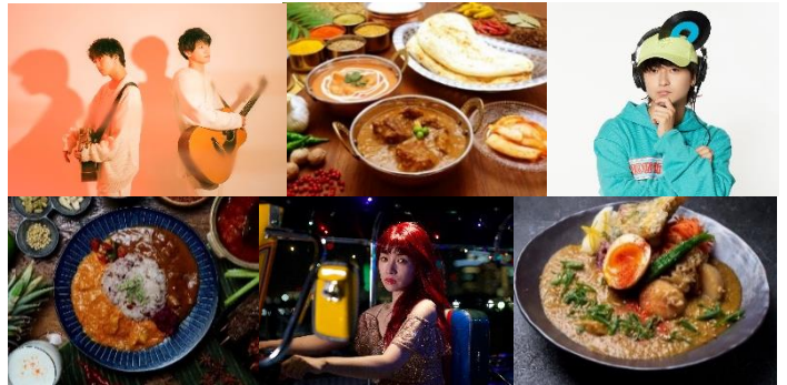
<タイムテーブル・出演アーティスト・出店カレーイメージ>

CURRY&MUSIC JAPAN 2023 実行委員会は、2023年7月14日(金)から7月17日(月・祝)の計4日間、横浜赤レンガ倉庫イベント広場にて『CURRY&MUSIC JAPAN 2023』を開催します。