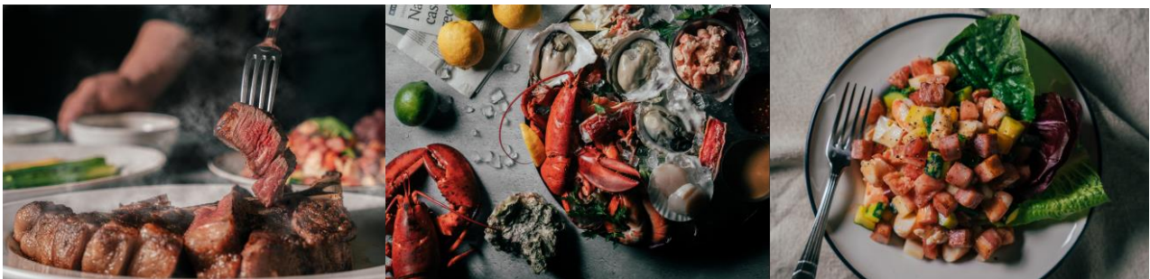
▲メニューイメージ