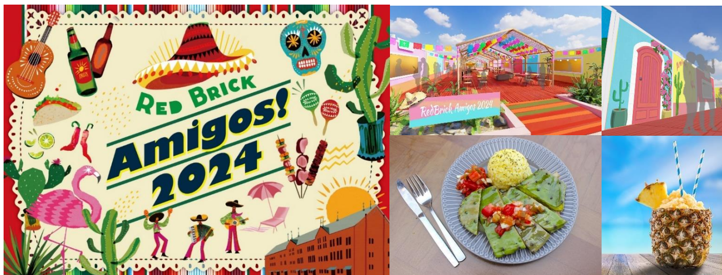
『Red Brick Amigos! 2024』キービジュアル

横浜赤レンガ倉庫では、2024年7月27日(土)から8月25日(日)の計30日間、横浜赤レンガ倉庫イベント広場にて『Red Brick Amigos! 2024』を開催します。※7月26日(金)は17:00プレオープン