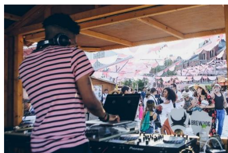
過去開催時の様子

人気クラブでプレイする DJ 陣を迎えたナイトイベントを日にち限定で開催します。