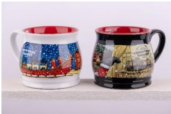
「オリジナルマグカップ」デザインイメージ

ファンも多く、毎年デザインが異なるため完売必至！白・黒 2 色展開。黒色のマグカップには、サンタクロースやトナカイが横浜赤レンガ倉庫に向かう昼の様子を描き、白色のマグカップには横浜赤レンガ倉庫のクリスマスマーケットの飾り付けを終え、会場が賑わっている様子をサンタクロースが遠くから眺めている夜の様子を描き、物語風に表現しました。