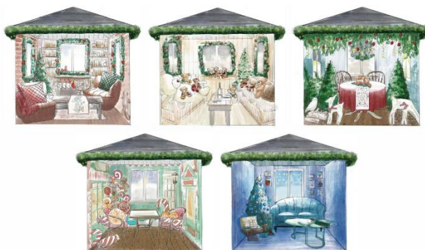
プレミアムラウンジ 内装イメージ