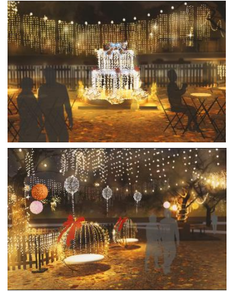
イルミネーションガーデン イメージ