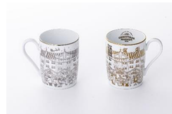
「プレミアムマグカップ」デザインイメージ

イベント初の「 プレミアムマグカップ 」。創立 120 周年を迎えた世界的洋食器ブランド「 リタケ 」とコラボ。リタケブランドの特長でもある美しい白磁に、趣のある横浜赤レンガ倉庫と本イベントの賑わいを表現したデザインを施しています。クリスマスらしい金と銀の 2 色展開で、各色のデザインにも違いがあります。屋根の上の絵柄にご注目いただくと、金色のマグカップにはサンタクロースたちが慌ててプレゼントを運んでいる様子が描かれ、銀色のマグカップには準備を完了させたサンタクロースが夜空に飛び立っていく様子が描かれています。