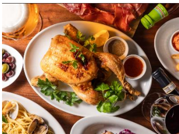
ロティサリーチキン イメージ

Café & Rotisserie LA COCORICO 名物の「薩摩ハーブ悠然鶏のロティサリーチキン」をはじめ、「彩野菜のポロネーゼポルチーニ風味」のショートパスタや濃厚なチョコレートブラウニーなど、クリスマスにふさわしいスペシャルなメニューを提供します。お料理をシェアいただく際には、世界的洋食器ブランド「リタケ」のテーブルウェアも特別にご用意し、料理を華やかに彩ります。