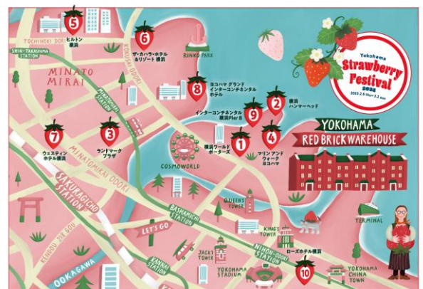
みなとみらい いちご巡りマップ イメージ

さらに、本イベントの開催期間中は、横浜・みなとみらいエリアを中心とした近隣の商業施設・ラグジュアリーホテル等でも様々な“いちごメニュー”を展開し、イベントを通じてエリア一帯がいちご色に染まる『みなとみらい いちご巡り』企画を実施。手軽にテイクアウトできるメニューや、人気店の限定メニュー、ホテルのスイーツbuffet等、様々な形でいちごを思う存分お楽しみいただけます。