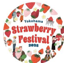
イベントオリジナルステッカー イメージ

※ランドマークプラザと横浜赤レンガ倉庫は、2月18日(火)休館日となります ※詳細は、特設サイトをご確認ください