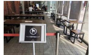
ガラスボックス同伴可能エリア