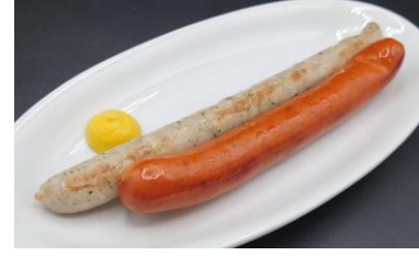
DOG FATHER グリルソーセージ (ブラートブルスト、デブレジャー) ¥900