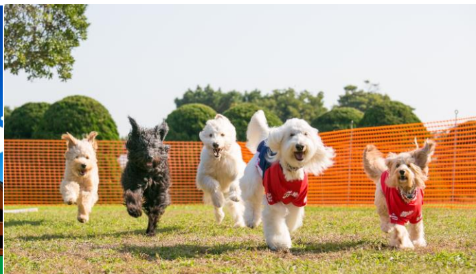
<ドッグランイメージ>