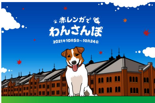
<メインビジュアル>

横浜赤レンガ倉庫では、10月5日(火)～10月24日(日)の計20日間、わんちゃんと一緒に横浜赤レンガ倉庫を楽しんでいただくおさんぽ企画『赤レンガでわんさんぽ』を開催します。海側に広がる赤レンガパークには特設ドッグランが登場。そのほか、ペットグッズを扱うショップが約20店舗集まるマーケットや、館内のカフェ&レストランの一部でも期間限定でわんちゃんの同伴が可能になるなど、愛犬家の皆さまが、わんちゃんと一緒に横浜赤レンガ倉庫を満喫できる様々なコンテンツをご用意しています。過ごしやすいこの季節、わんちゃんと一緒に、横浜赤レンガ倉庫で「行楽の秋」をお楽しみください。※開催内容は予告なく変更・中止になる場合がございます。