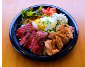
燻製スギヤ商店 ローストビーフとスパイスチキンの燻製ドライカレー ¥950