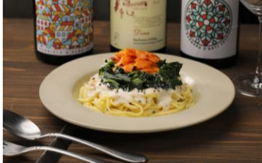
Kitchen macaroni スモークサーモンとほうれん草のクリームソース ¥880