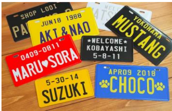
LODIWORKS オリジナルプレート 内容により異なる

わんちゃん用フードやハンドメイドの首輪など約20店舗が大集合するドッグマーケット【イヌイチ】。愛犬の名前などを自由に加工できるオリジナルプレートや、わんちゃんの似顔絵を描いてくれるブースも登場し、『赤レンガでわんさんぽ』の思い出を記念にお持ち帰りいただけます。