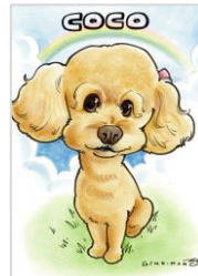
わんちゃん似顔絵 似顔絵専門店 カリカチュア・ジャパン ¥1,980～