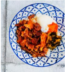
A.SU Asian Soup Kitchen 台湾牛肉飯(ニューロウハン) ¥800

秋の食材をたっぷり使ったフードトラックが週替わりでイベント広場に登場。できたての秋グルメをお楽しみください。