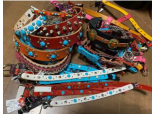
☆BYJ オリジナル首輪 ¥3,300～