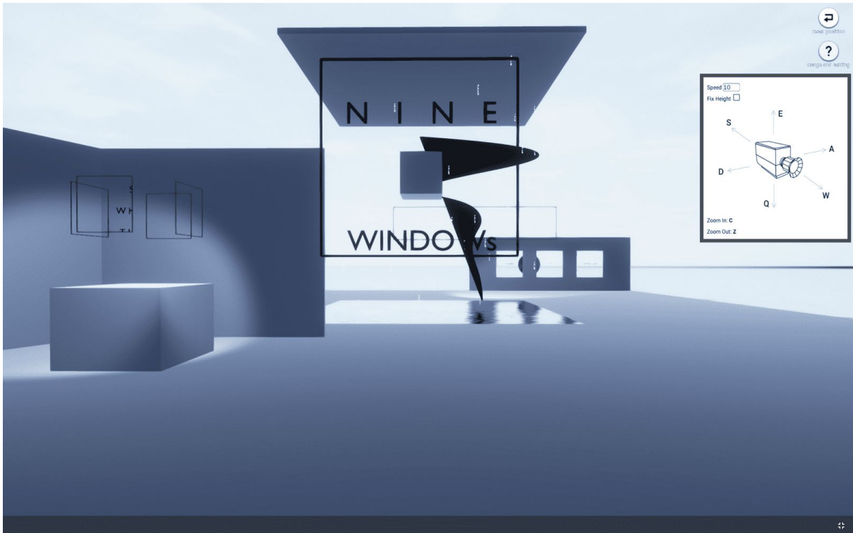
STYLY Webプレイヤー操作画面