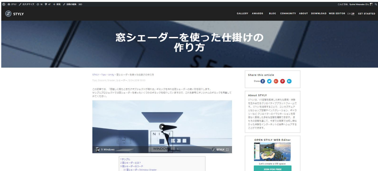
サイトにVR空間を埋め込んだ際の見え方 (参考記事： https://styly.cc/tips/9windows_discont_windowshader/ )