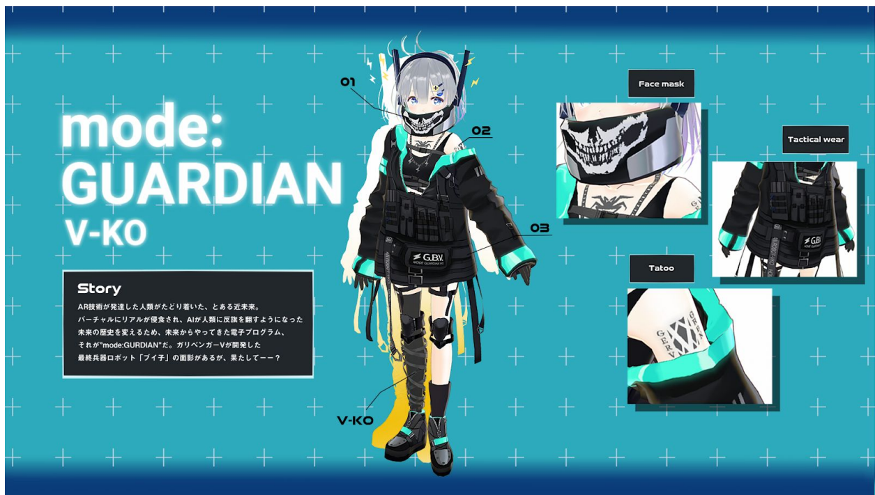
3Dキャラクターモデル「mode:GUARDIAN」 (キャラクターデザイン・3Dモデリング : Mitra)