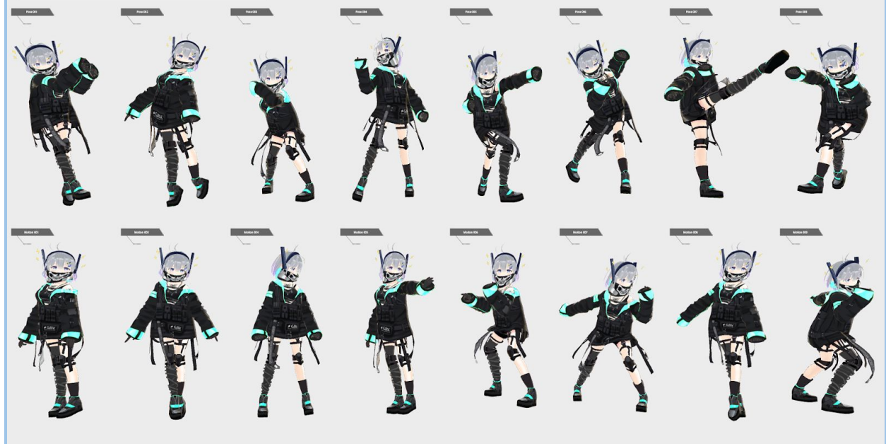
キャラクターモーション・ポーズ全57種（画像は一部抜粋）

「STYLY Studio」内に追加されたこれらのアセットを使えば、高価なVR対応PC機材やプログラミング・3Dモデリングの専門知識の必要なく、ウェブブラウザと想像力だけで自由にあなただけのARキャラクタージオラマを作ることが可能です。また完成した作品はスマートフォンアプリ「STYLY Mobile」を通じて、キャラクターとその世界観を表現したジオラマを現実世界に召喚することができます。