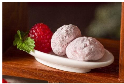
ラズベリースノーボール