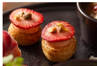
サーモントラウトムースの グジェール