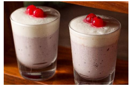
ブルーベリーのムース