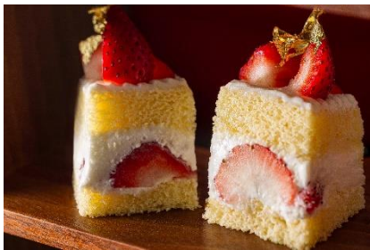
クリスマスショートケーキ