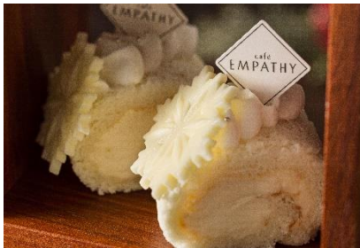
ホワイトロールケーキ