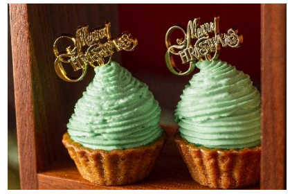
クリスマスツリータルト