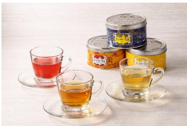
150年の歴史を誇るフランスを代表するプレミアムティーメゾン「クスミティー (KUSMI TEA)」

コーヒーやKUSMI TEA など、さまざまな種類のドリンクをお楽しみいただけます。