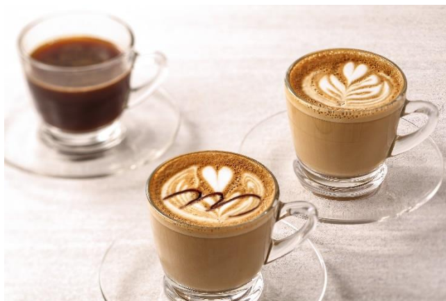
コーヒー、カフェラテ