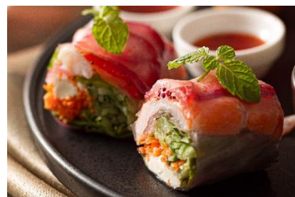
エビといちごの生春巻き