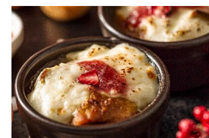
いちごの焼きカレー