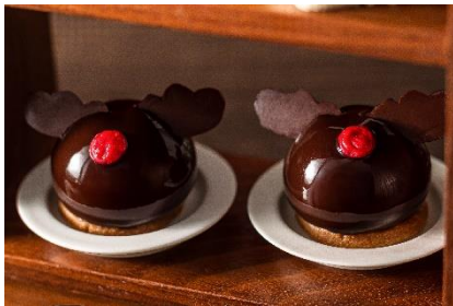
トナカイのムースケーキ