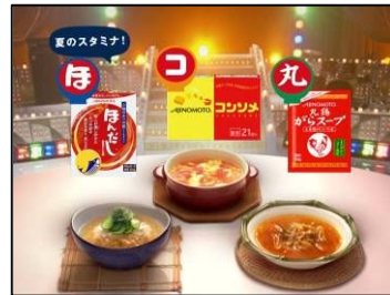
(NA) あなたの ほこ丸レシピが