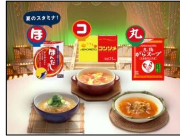
(NA) あなたの ほこ丸レシピが