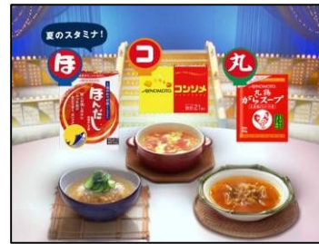
(NA) あなたの ほこ丸レシピが