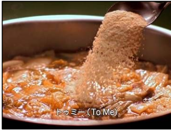
トゥミー (To Me)