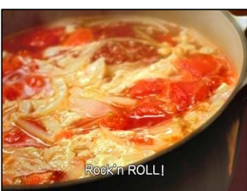
Rock' n ROLL!!