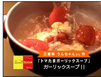
ガーリックスープ!!