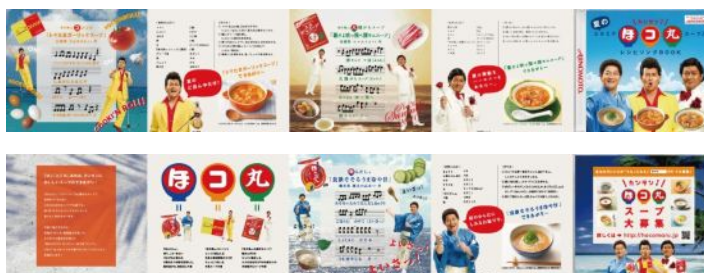
メニューリーフレット