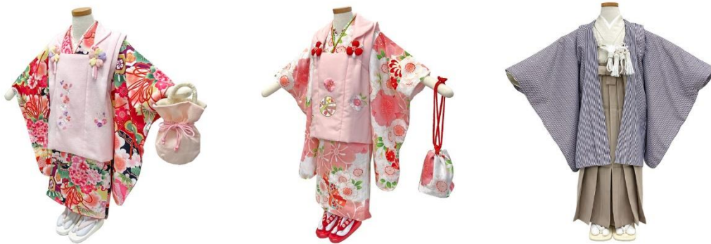
▲3歳女の子（式部浪漫）

多様なお祝いの仕方が増える中、それぞれの家族に合った形で、多くの選択肢から好みの衣装をゆっくりお選びいただけるよう、新柄を追加いたしました。定番人気の吉祥文様から、モダンな柄までフルセットでご用意。お気に入りの一着を見つけてください。