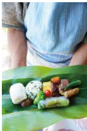
安座真ムーンライト・テラス ～東御廻りエコ弁当～