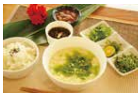
Cafe わがん/セーふあキッチン ～ひき寄せ豆腐～