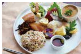
Cafe やぶさち ～古代米プレート～