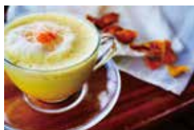
南国フルーツパーラー JyoGoo ～セーファ黄金ラテ～