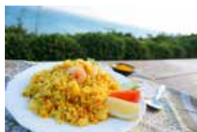
カフェくるくま ～知念グスク薬草チャーハン～