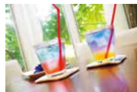
garden Kuu cafe ～Rainbow Tea ヲナリブレンド～