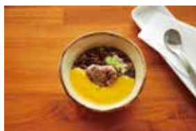
douce cafe nanjo ～神の島・五穀ぜんざい～