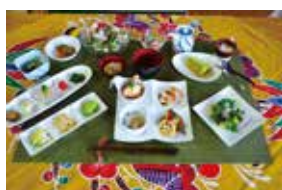
タルタルーガ ～御川コース～