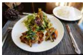
CAFE 風樹 ～ハンバーグ樋川クレソン添え～