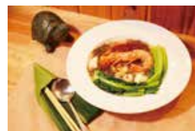
居酒屋 大ちゃん ～覇者の海鮮カチャーシー～