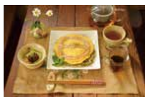
joy 工房&茶屋 ～食楽森オムそば～