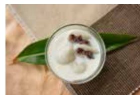
かき氷のお店 苺 ～ミルク様のほっと大福～