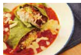
うちのやまち ～須久名ブリトー～

店舗の地図やオリジナルガイドブックは「Vitamin-N」公式サイトでも配信中！ http://vitamin-n.okinawa/